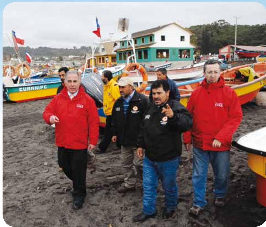
El litoral de Pelluhue y Curanipe resultó devastado por el tsunami de febrero pasado. Afortunadamente hoy retoma su productividad gracias al apoyo gubernamental y de privados.