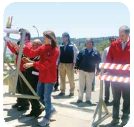
Intendente Rodrigo Galilea en compañía de los gobernadores y seremis del Maule.